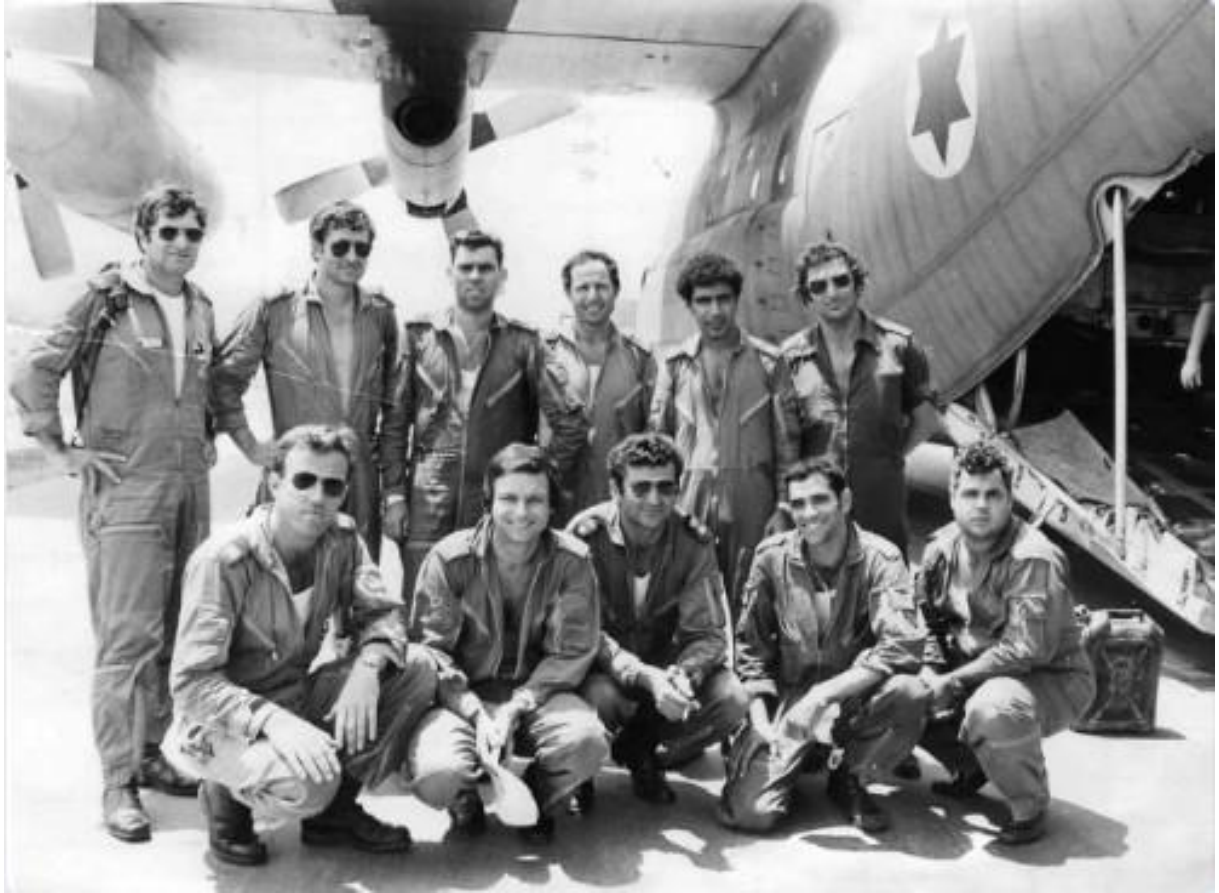
Görev sonrası, uçaklarının önünde poz veren C-130 mürettebatı.

Ancak, dünyanın eşi benzeri olmayan en cüretkar nokta operasyonu, İsrail Özel Kuvvetler mensupları tarafından Temmuz 1976'da gerçekleştirilmiştir. 27 Haziran 1976 günü Tel Aviv'e gitmekte olan Air France Havayollarına ait bir yolcu uçağı, her zamanki gibi Atina'ya inmiştir. Uçak Atina'da Filistin Halk Kurtuluş Cephesi ve Almanya'nın Bader-Meinhof çetesinden dört hava korsanı tarafından kaçırılarak Bingazi'ye götürülür. Yakıt ikmalinin ardından uçak, dört korsanın daha ekibe katıldığı Entebbe'ye gider. Uganda Devlet Başkanı, "Afrika Kasabı" lakaplı İdi Amin'dir ve rehinelere ile hava korsanlarını memnuniyetle karşılamıştır. Hava korsanları, 53 Filistinli tutuklunun serbest bırakılmasını ve 5 milyon dolar fidye talep ederler.