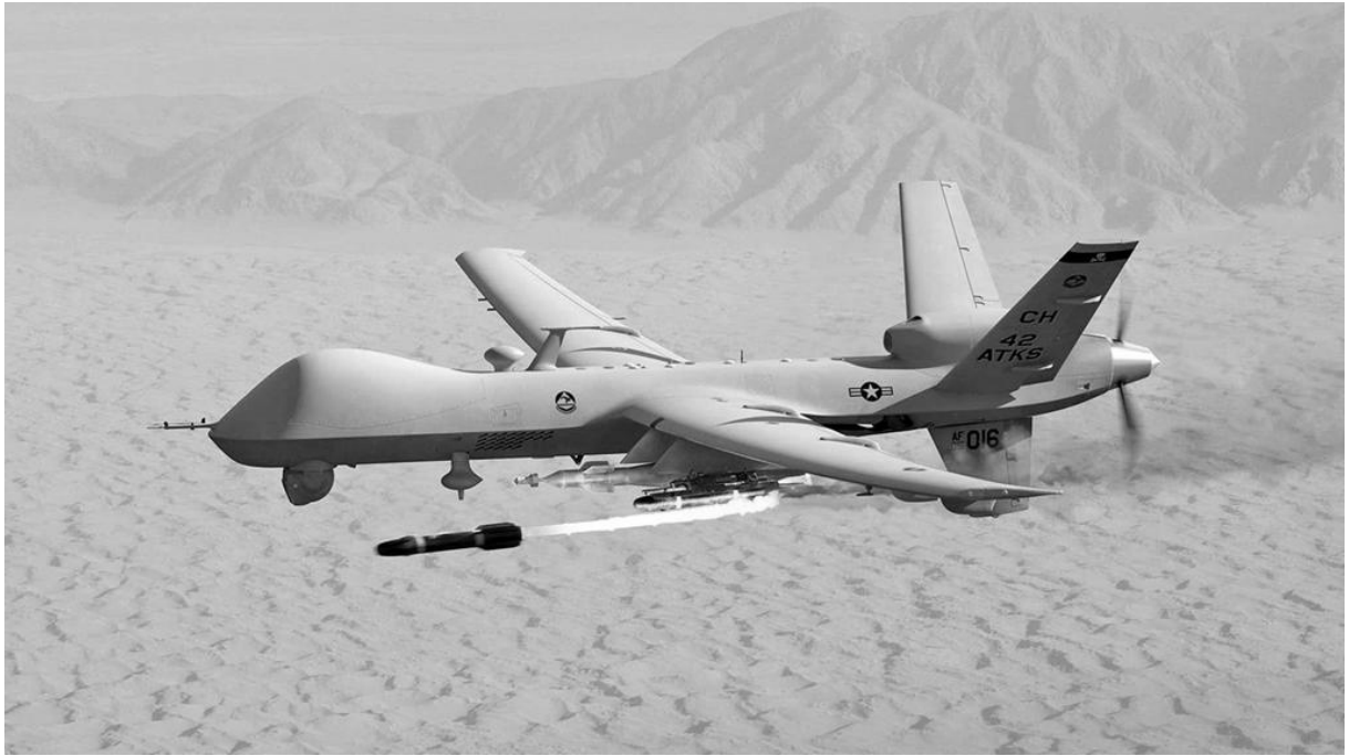
Hellfire füzesi fırlatan MQ-9 Reaper

28 Eylül 2016 gecesi özel olarak eğitilmiş yaklaşık 100 Hint komandosu mevzilerinde saldırı için hazırdır. Yüzleri kamuflaj boyları ile boyalı komandolar, ormanın içinde 48 saattir pusuda beklemektedir, hepsi de 18 Eylül günü kaybettikleri silah arkadaşlarının intikamını almak için bilenmiş durumdadır.