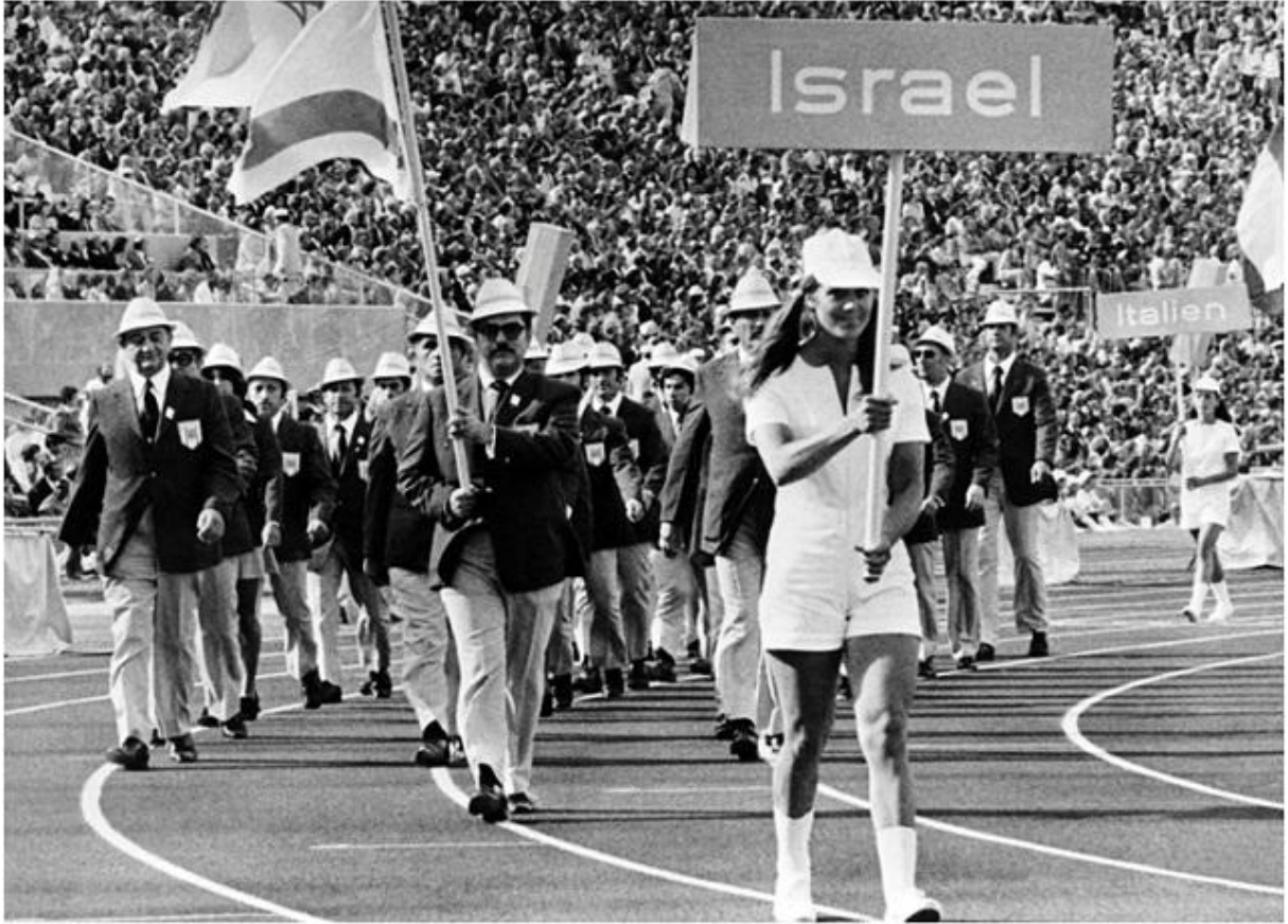
Münich Olimpiyatlarına katılan İsraili sporcular geçit töreni esnasında, 26 Ağustos 1972.

İsrail Başbakanı Golda Meir, askeri danışmanı tarafından 05 Eylül 1972 günü, Münich Olimpiyatlarına katılan iki İsraili sporcunun nasıl öldürüldüğünü seyretmesi için uyandırılır. Dokuz İsraili sporcu da teröristler tarafından rehin alınmıştır. Golda Meir Alman yetkililere, İsrail Savunma Kuvvetleri'nin en iyi komando birliği olan Sayeret Matkal'ın yardım etmesini teklif eder. Ancak Almanlar, İsrail'in yardımı olmadan rehinelere kurtaracaklarını söyler.