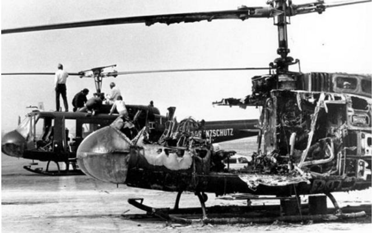
Alman güvenlik güçleri ve teröristler arasında çıkan çatışma sonrasında bir helikopterin durumu.

Golda Meir güçlü, sert ve acımasız bir kadındır ve Münich katliamına katılan teröristlerin cezalandırılmadan kurtulmasından hoşlanmamıştır. Black September – Kara Eylül adlı terör örgütünün durdurulmasının tek yolu Nokta Operasyonlarıdır. Golda Meir, Mossad şefine, Kara Eylül terör örgütünün liderlerinin öldürülmesi emrini verir. Bu operasyon 20 yıl kadar sürecektir.