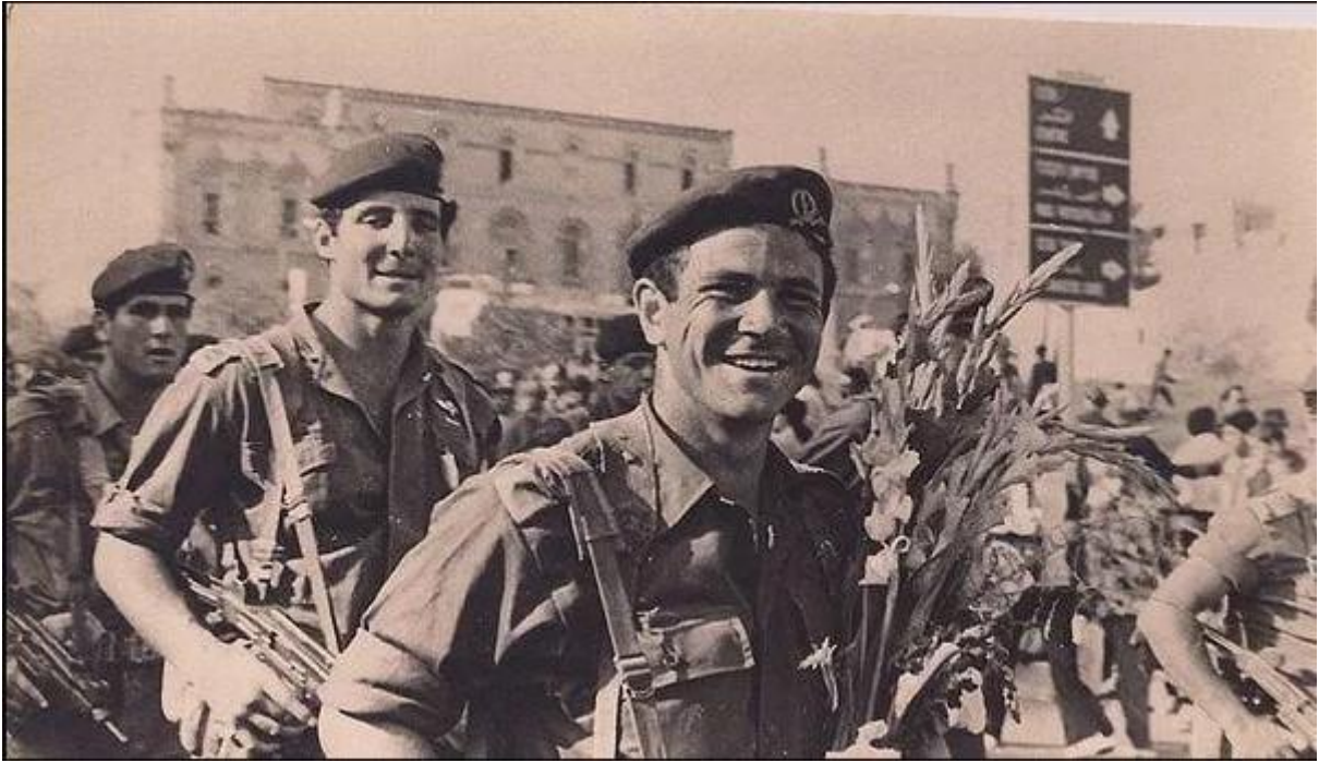
Sayeret Matkal Komutanlarından Ehud Barak, Operation Spring of Youth, 1973.