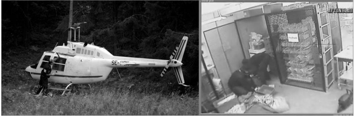
Solda soygunda kullanılan çalıntı helikopter, sağda ise soyguncular kasayı boşaltırken görülmektedir.

23 Eylül 2009 sabahı saat 05.15'te dört hırsız, çalıntı bir Bell 206 Jet Ranger modeli helikopter ile İsveç'in Vastberga kentindeki G4S Nakit Deposu'nun çatısına iner. Piramit şeklindeki büyük çatı penceresinden içeri giren hırsızlar özel olarak uzatılmış merdivenler kullanarak deponun sayım odasına inerler. Özel patlayıcılar kullanarak deponun kapısını açan hırsızlar elektrikli testere kullanarak kasaları açarlar. Hırsızlar tekrar çatıya döndüklerinde inişlerinden itibaren sadece 20 dakika geçmiştir ve yanlarında çaldıkları 6,1 milyon dolar nakit para bulunmaktadır. Sırbistan polisi daha önce uyardığından, İsveç polisi Eylül 2009 ayı içinde büyük bir nakit deposuna helikopterli bir saldırı yapılmasını beklemektedir. Ancak hırsızların nakit deposuna ulaşan yollara çivili engeller yayarak ve polis helikopter pistinin yanına bomba süsü verilmiş paketler yerleştirerek emniyet güçlerinin müdahalesini geciktireceğini beklememektedirler.