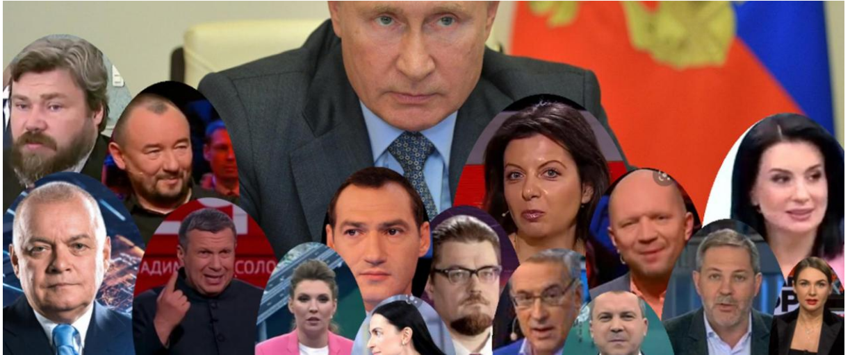
Putin'in kukla medyası.

Putin'in seçmenleri için ana ve belki de tek bilgi kaynağı olarak kullanılan 7/24 televizyon çağında, video olmadan hiçbir şey yapılamaz. Örneğin haysiyetsiz ve kötü şöhretli TV spikeri Dmitry Kiselev, televizyon ekranlarında Ukraynalı soyadı olan bir adama verilen SS (SchutzStaffel – Koruma Taburları) sertifikasını gösterirken, adı geçen SS sertifikasının, İkinci Dünya Savaşı esnasında kullanılabileceği uymayan modern