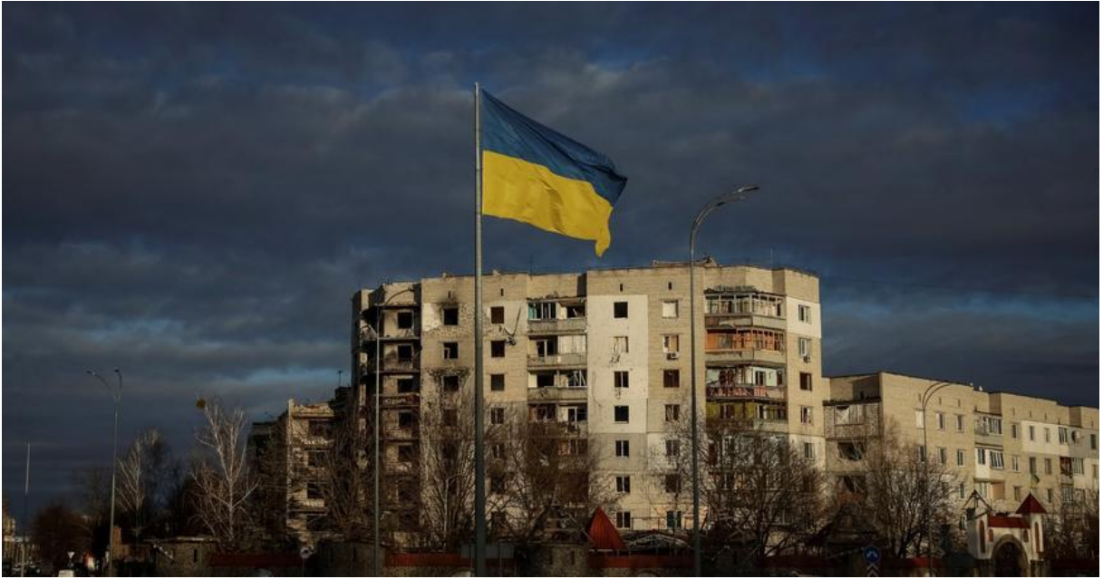
Ruslar tarafından vurulan Borodianka kentinde dalgalanan Ukrayna bayrağı, 15 Şubat 2023.

Kötü şöhretli “küçük yeşil adamlar” örneğinde, askerler üzerlerinde hiçbir tanıtıcı amblem olmayan üniformalar giyerken ellerinde de makineli tüfekler taşımaktadır. Küçük yeşil adamlar bunun yanı sıra, yerel Ukrayna halkıyla da aynı dili konuşmaktadır. Kullanılan dil nedeniyle bir yabancıнын hemen tanınabileceği örneğin Estonya gibi başka bir ülkeye Rus müdahalesinde aynı dili avantajı işe yaramayacaktır.