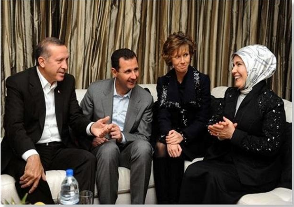
Türk ve Suriye liderleri, eşleriyle birlikte bir zamanlar mutlu günlerinde.

Yıldırım; “Bir bayrak hikâyesidir gidiyor. Irak Anayasası’na göre, kuzey Kürdistan Bölgesel Yönetimi özerk bir yapıdır. Parlamentosu, başbakanı, bakanları, bayrağı vardır ve dünyada da bu şekilde tanınır. Yeni bir uygulamaymış gibi bunu gündeme getirmenin iyi niyetle izahı mümkün değil. Türkiye, Irak’ın toprak bütünlüğüne sonuna kadar saygı duyar, Irak Anayasası’nın gereği neyse saygı duyar. Bizim bunun dışında başka diplomatik teamül geliştirmek gibi bir uygulamamız olmadı.” açıklamasını yapmıştır.