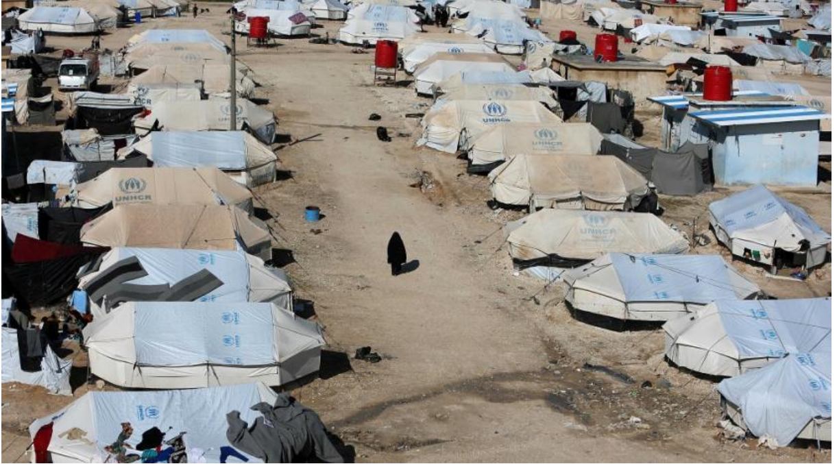
Al-Hol mülteci kampında yürüyen bir kadın, Suriye, 02 Nisan 2019: Fotoğraf: Reuters

Ayrıca, Türk hava saldırılarında SDF'nin özel harekât terörle mücadele gücü komutanı Jiyan Tolhildan da öldürülmüştür. Temmuz 2022'de, Ankara yeniden kuzeydoğu Suriye'ye yönelik bir kara işgali tehdidinde bulunurken, düzenlenen bir Türk insansız hava aracı saldırısında, SDF'nin bir komutan yardımcısı ve yanındaki en az iki savaşçı arkadaşını öldürülmüştür.